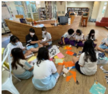
協助主題書展布展及美工