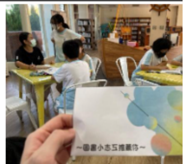
志工好書推薦活動小卡製作