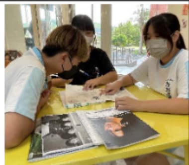
討論雜誌期刊推廣辦法