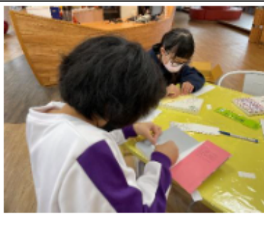
學習新書編目及標籤張貼