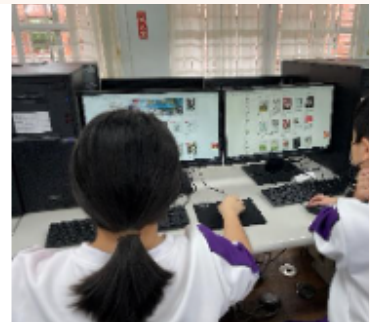
圖書館藏系統課程培訓