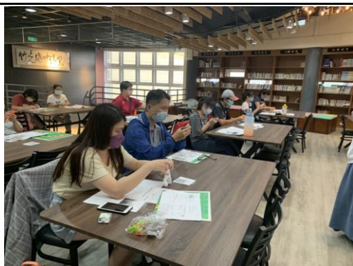
與會老師運作自己手上的陶土製作自己的人偶