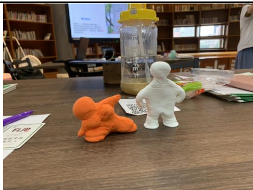
老師捏的人偶真的站立起來了~好厲害 😊