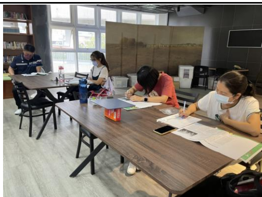
音樂聲中，與會老師閱讀亞里斯多德、孟德斯鳩及羅爾斯對於公平的看法。