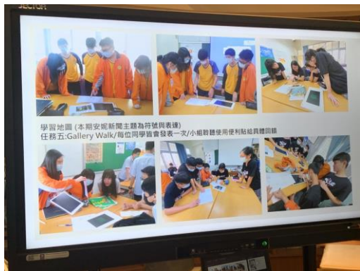
孩子們在課程中閱讀與討論與發表，十分忙碌，一直動腦也不斷表達。