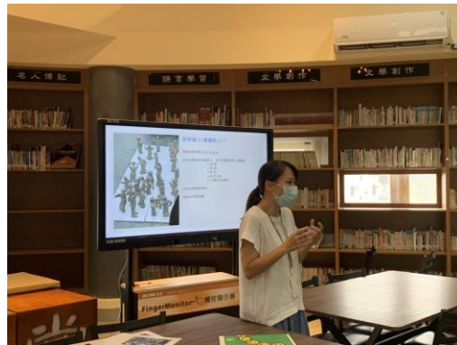
宗鳳老師介紹另一個新的安妮新聞教案”好好做人!作個好人?!”