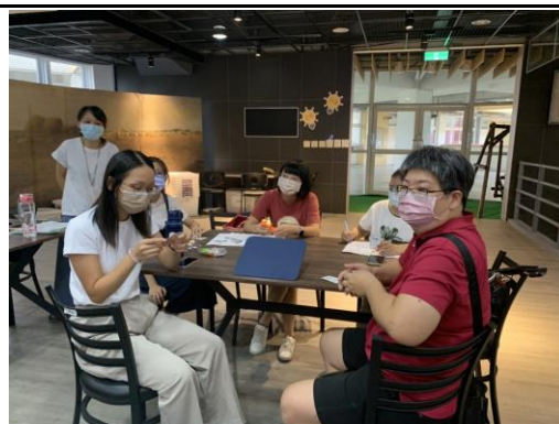
老師分享大掃除時的學生角色分配