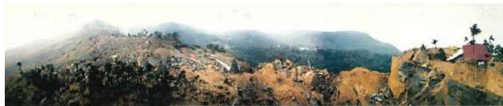
一九九九年九二一集集大地震圍堵柳巷村九份二山災區臨時安置營地