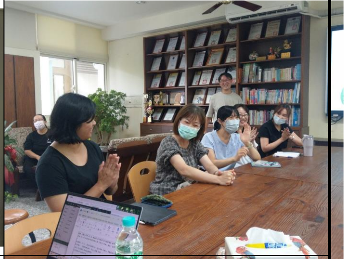
各校交流素養導向教學多元評量的設計