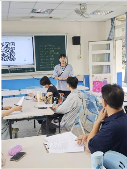
說明：佩文主任說課