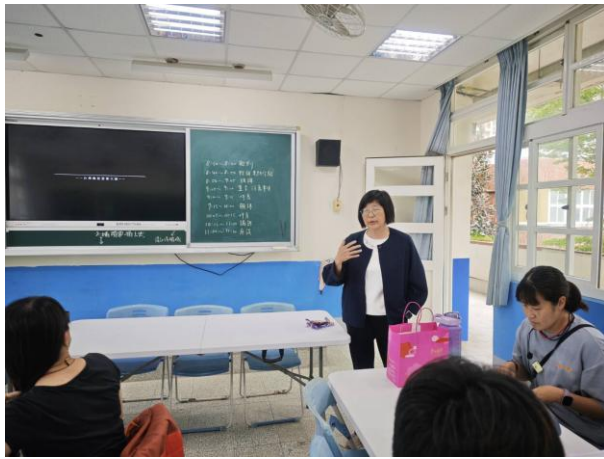
說明：蔚雯校長開場