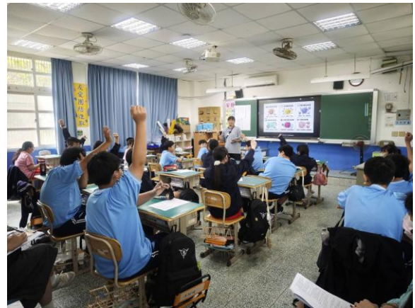
說明：學生上課學行熱烈