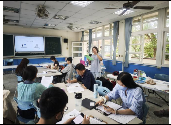
說明：美紅副召說明今天觀議課重點，除佩文主任的課堂教學，也請觀察學生學習行為，並給予鼓勵小卡。