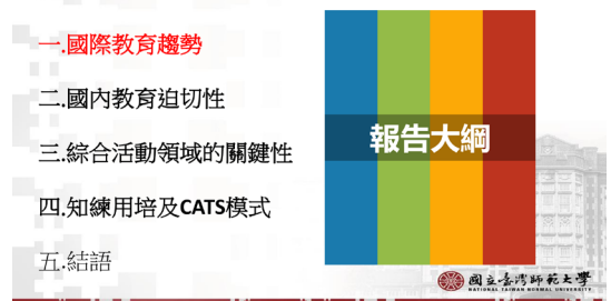
說明：今天開幕演講大綱