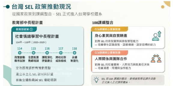
說明：台灣SEL政策推動現況

說明：幸福感由何而來？50%來自基金，40%來自看待及因應外在的方式，而這40%是可以教導與學習的，我們在進行社會情緒學習，就是在學習此一部份。